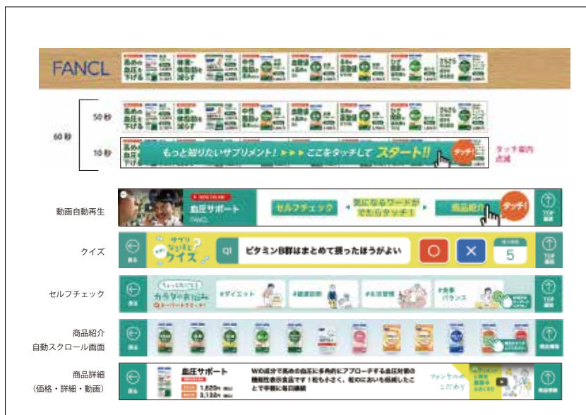
店頭用オリジナルコンテンツをご提案 (一部抜粋)

コンテンツ&ハード制作 ワンストップソリューションの お問い合わせは smartbar@yutaka-web.co.jp