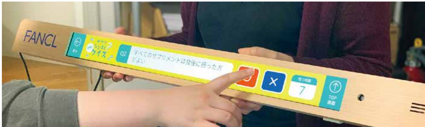
タッチで、商品の情報をお客様に提供

デジタルサイネージ「SmartBar」は店舗でタッチ操作が可能。映像や音声にタッチを加えることで顧客の能動的な購買シーンを演出します。インターネットを通じて取得したデータを元に、顧客行動パターンや販売状況の情報収集に繋げ、マーケティングデータとして活用することが可能です。